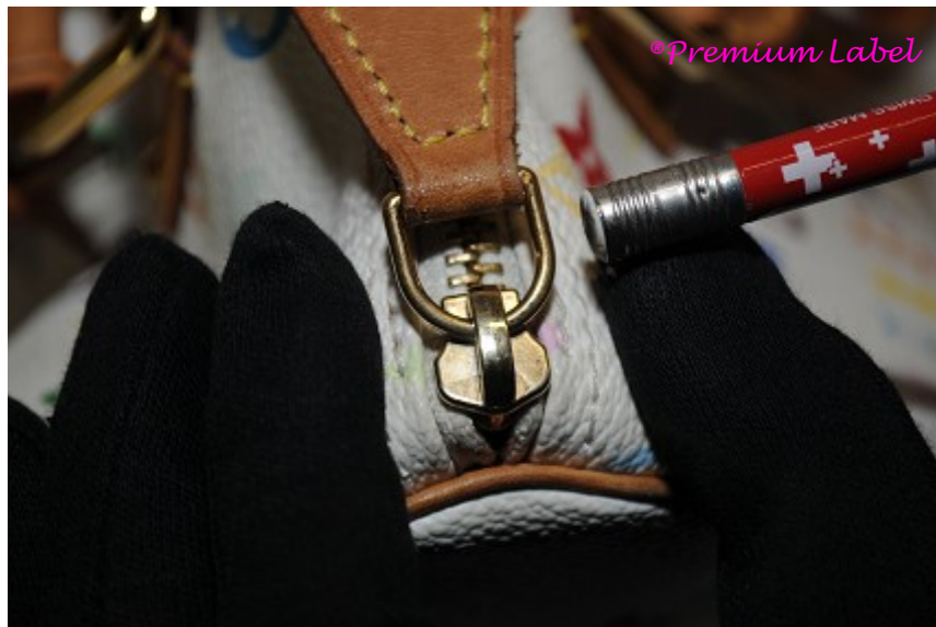
Das Original: Der Reissverschluss